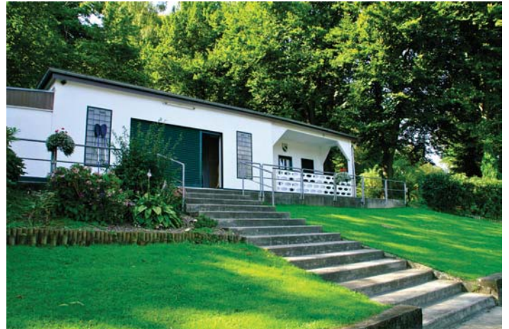
Unser Bootshaus im schönen, ruhigen Wichteltal

Dresden aus neuer Perspektive sehen? Oder die Weinlandschaften mit ihren Städtchen und Dörfern an Mosel, Main oder Unstrut genießen? Burgen, Schlösser und Klöster an Donau, Saale oder Lahn an sich vorbeigleiten lassen?