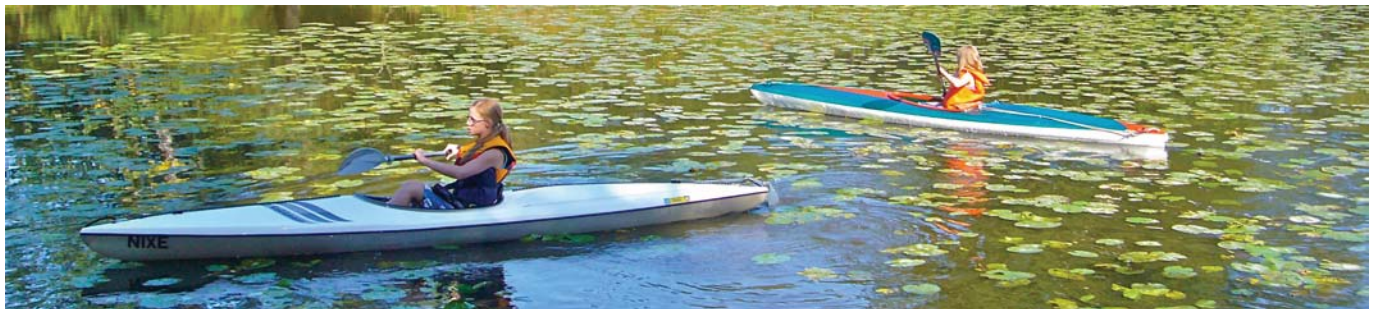
Erste Versuche in unserem Hafen

Jeden Freitag ab 16 Uhr ist „Schnupperstunde“ auf dem Wasser und um sich kennenzulernen.